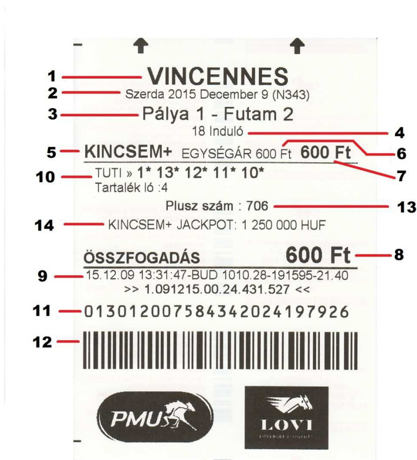
2a. sz. ábra

A fenti jellemzőkkel ellátott fogadószevény a 2a. sz. ábrán található.